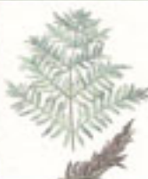
Fleito real ( Quercus robur )

Planta sen flores, de follas moi grandes, que poden acadar os 2 m. de altura. Coñecido como fleito real polo seu elegante porte. Tivo presenza na terra dende a época dos dinosaurios, existindo fósiles dende hai 65 millóns de anos.