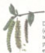
Bétueiro ( Betula pendula )

Árbore exótica da familia das mirtáceas procedente de Australia que alcanza gran altura (ata 40m.). A súa casca é lisa e de cor agrisada. A madoira é moi útil, e das súas follas estráese a esencia de Eucalipto que arrocende ben e ten propiedades medicinais.